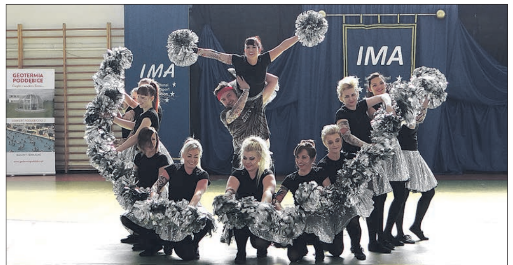
Szyk - mamy mażorettek