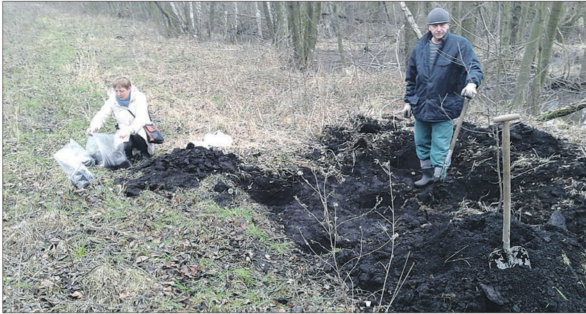
Torfy z Wilczkowa mają lecznicze właściwości

– Dla nas to bardzo dobra i ważna informacja, ponieważ surowiec ten idealnie wkomponuje się w strategię stworzenia strefy uzdrowiskowej i nadania Gminie statusu uzdrowiska. Mamy borowinę i wodę termalną, Poddębickie Centrum Zdrowia, park o charakterze zdrojowym, Dom Pracy Twórczej, baseny, dwóch przedsiębiorców otrzymało dotacje na budowę infrastruktury hotelowej. To cieszy i zaczyna układać się w całość. Te wszystkie działania mają być kołem na-