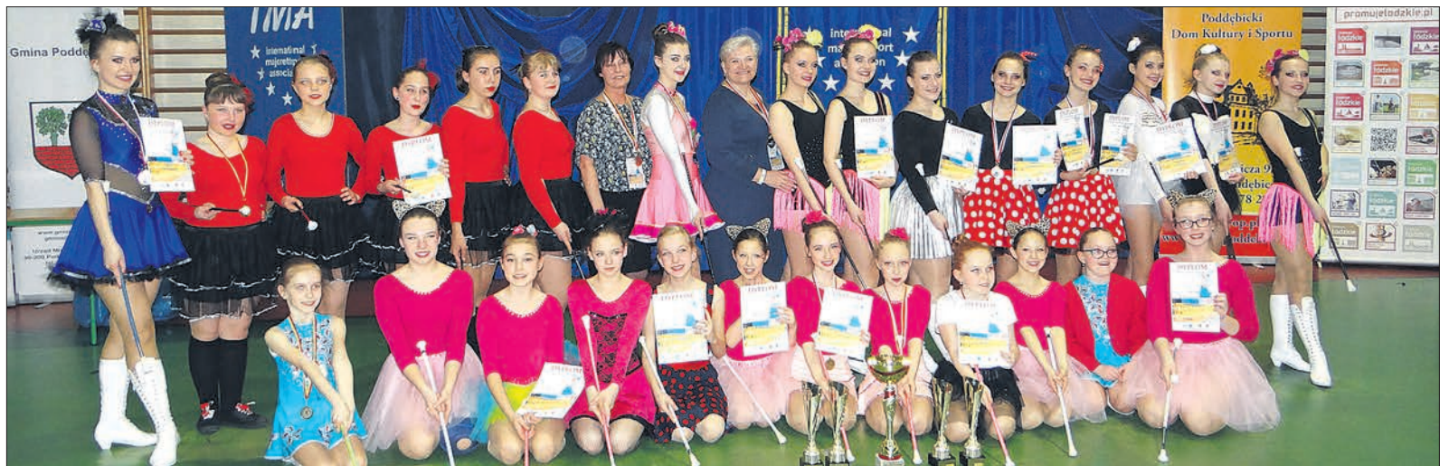
Mażoretki Podębickiego Domu Kultury i Sportu