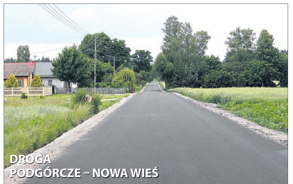
DROGA PODGÓRCZE – NOWA WIEŚ

Poddębicki samorząd nie tylko przy wsparciu środków unijnych wybudował drogi na swoim obszarze. Dzięki funduszom z Narodowego Programu Przebudowy Dróg Lokalnych powstały odcinki: Panaszew-Lubocha (wspólnie z Gminą Dalików), Pudłówek-Piotrów (wspólnie z Gminą Zadzim), Bałdrzychów-Podgórcze-Malenie, Krępa-Truskawiec, Góra Bałdrzychowska-Feliksów, Dzierżazna-Izabela-Balin (wspólnie z Powiatem Poddębickim), Golice-Nowa Wieś (wspólnie z Gminą Wartkowice), ul. Miła w Poddębicach (wspólnie z Powiatem Poddębickim), ul. Zielona w Poddębicach. Nawierzchnie asfaltowe pojawiły się także w miejscowościach: Malenie, Sempółki, Zagórzycze, Pudłówek, Rąkczyn, Sworawa, Niewiesz, Stary Pudłów, Praga, Nowy Pudłów, Kolonia Chropy, Szarów, Antonina, Tarnowa, Karnice, Panaszew, Ciężków, Lipnica, Balin, Dominikowice, Łężki, Byczyna, Mrowiczna, Józefów, Nowa Wieś, Podgórcze, Góra Bałdrzychowska Kolonia, Antoninów. W mieście przebudowano ulice: Rzemieślnicza, Dębowa, Krótką, Młynarską, Kosmonautów, Sobieskiego, Ogrodową, Mickiewicza, Narutowicza, Sienkiewicza, Pułaskiego, Kilińskiego, pl. Kościuszki, Wodną, Nadrzeczną, Przejazd, Polną. Generalna Dyrekcja Dróg Krajowych i Autostrad wybudowała rondo na skrzyżowaniu ul. Łódzkiej i Łęczyckiej, a Urząd Marszałkowski Województwa Łódzkiego drogę z Poddębic w kierunku autostrady.