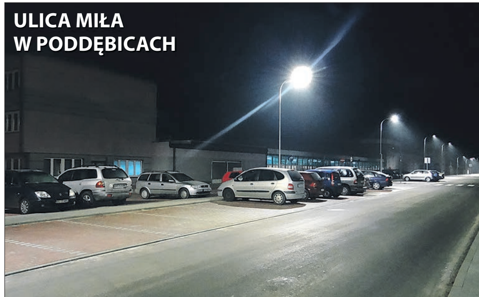
ULICA MIŁA W PODDĘBICACH

go samorządu, przez co udało się przeprowadzić kolejne przedsięwzięcia: