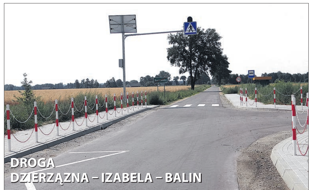
DROGA DZIERŻAZNA – IZABELA – BALIN