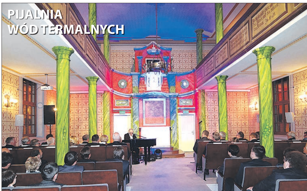
PIJALNIA WÓD TERMALNYCH

W dawnym kościele ewangelicko-augsburskim w Podębicach utworzona została Pijalnia Wód Termalnych-Teatr Integracji. Można tu napić się wody termalnej liczącej 27 tysięcy lat i wydobywanej z głębokości 2101 metrów. Wartość powstania pijalni wyniosła 2,1 mln zł. Wsparcie z RPO WŁ w kwocie 1,7 mln zł.