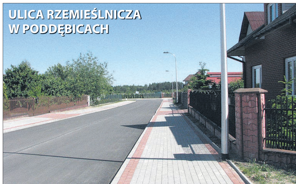
ULICA RZEMIEŚLNICZA W PODDĘBICACH