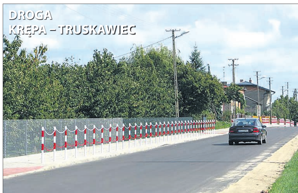
DROGA KRĘPA – TRUSKAWIEC