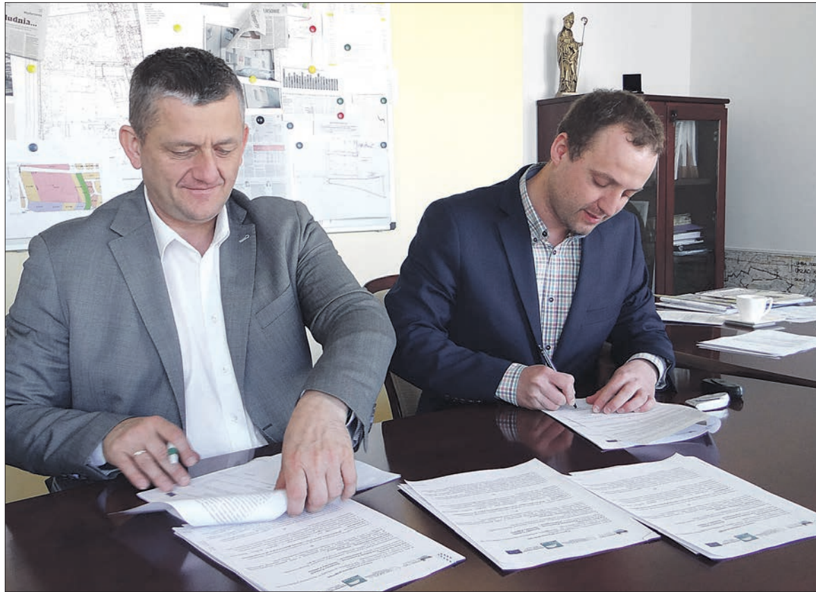
Podpisanie umowy na budowę placu zabaw i siłowni plenerowej

Plac zabaw przy ul. Grunwaldzkiej powstanie na powierzchni 1710 m.kw. Obecna infrastruktura nie spełnia oczekiwań, a mieszkańcy sąsiadujących bloków i domków jednorodzinnych zabiegali o utworzenie nowego miej-