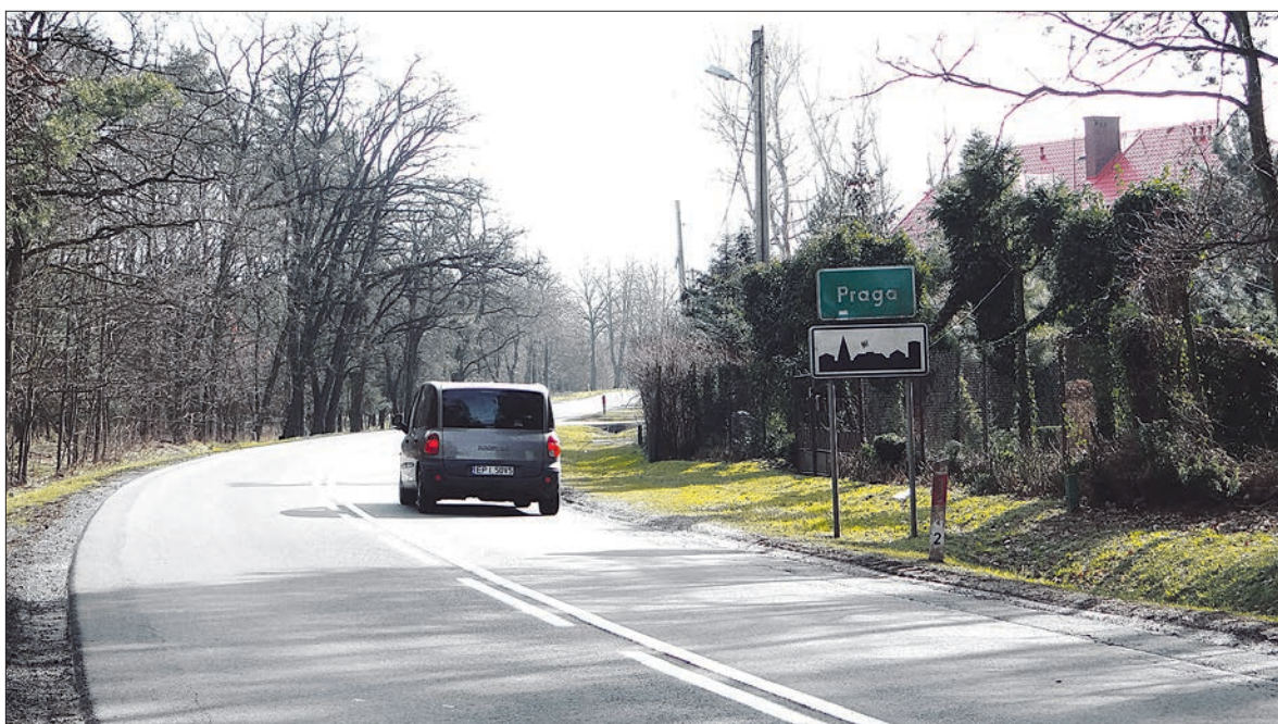
Jest duża szansa, że w Pradze zostanie wybudowana obwodnica wsi

O budowie obwodnicy Pragi mówi się od dawna. Oczekują jej mieszkańcy zarówno tej miejscowości, jak i sąsiednich, bo natężenie ruchu na tym odcinku trasy wojewódzkiej nr 703 jest ogromne. Budowę ma być objęte 1,2 km drogi w nowym śladzie.