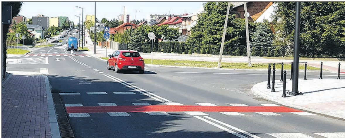
Przebudowana ulica Zielona jest jedną z reprezentacyjnych w naszym mieście

Jedna z głównych dróg w mieście została oficjalnie otwarta po przebudowie. Jest bezpieczna i nowoczesna.