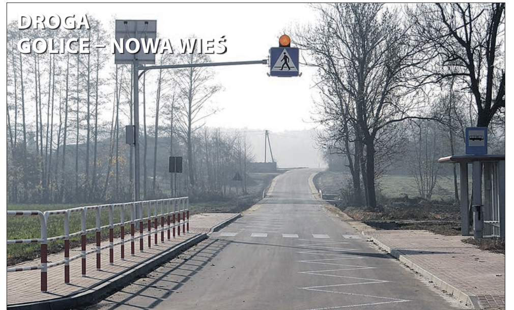
DROGA GOLICE – NOWA WIEŚ