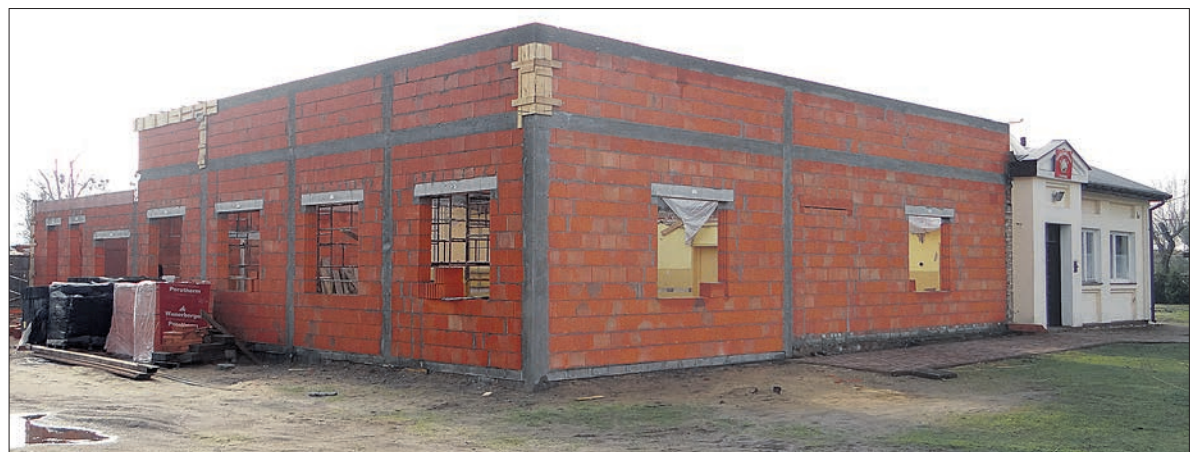
Stały mury Centrum Integracji i Aktywizacji w Klementowie

W Centrum poza działalnością kulturalną, prowadzona będzie działalność aktywizacyjna, szkolenia mające wpływ na zwiększenie tożsamości lokalnej mieszkańców, szczególnie skierowane do osób starszych, rodziców małych dzieci, a także osób niepełnosprawnych.