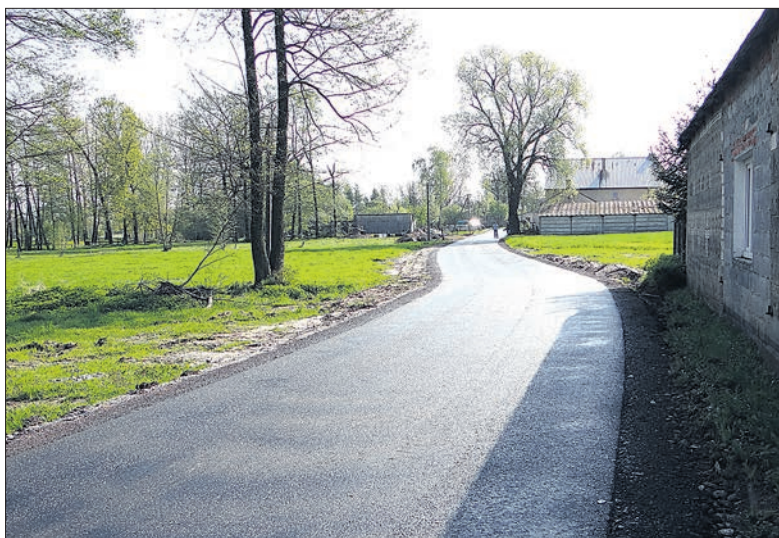
Nowa nawierzchnia w Antoninowie

Mieszkańcy Antoninowa doczekali się asfaltowego dywanika. Tym samym pozbyli się problemu z dojazdem do domów i gospodarstw.