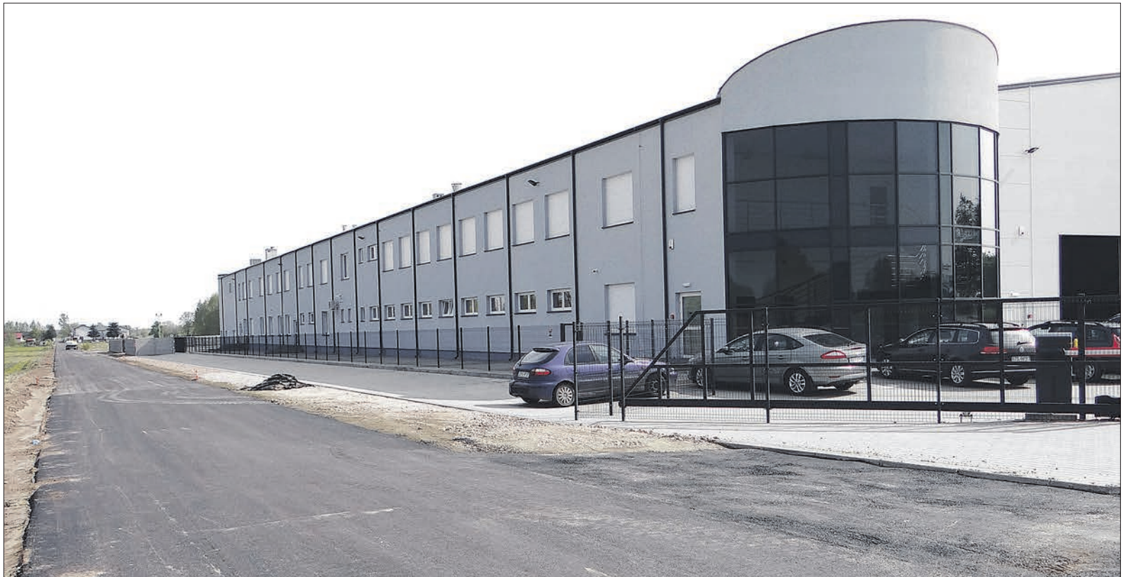
Nawierzchnia asfaltowa pojawiła się przy nowo powstałym zakładzie w Feliksowie

Zajmująca się wytwarzaniem kadzi do transformatorów jednofazowych oraz obróbką elementów na maszynach sterowanych numerycznie „Narzędziownia” swą działalność w Feliksowie rozpoczęła w 2015 roku. Radni Rady Miejskiej w Poddębicach wprowadzili zmiany w planie zagospodarowania przestrzennego, dzięki czemu firma mogła się rozbudować. W bieżącym roku uruchomiony został drugi budynek spółki, w którym obok hali produkcyjnej znajdują się pomieszczenia biurowe oraz magazyny. Fabryka po osiągnięciu pełnej mocy produkcyjnej ma zatrudniać około 300 osób. Naturalne jest więc, że do powstałego zakładu pracownicy muszą mieć jak dotrzeć.